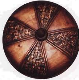
wooden pot Safeway safeway.com

Harmony consists of elements working together to form visually pleasing cohesiveness. This does not mean that you have to match everything; that would make for a very bland space. Harmony simply means that furniture, art and accessories complement each other. For example, if you are using a striped fabric with a plaid fabric, add harmony by using the same colors as solids or carrying through the texture of the material.