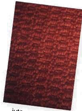
jute rug K-Mart kmart.com

Texture can add interest and volume to a space, especially if you have selected a monochromatic color scheme. For example, if you choose to decorate an entire room in shades of cream, you may want to add leather or suede accessories, toile or linen window treatments and a wool shag rug. Add a white feather boa for a touch of whimsy.