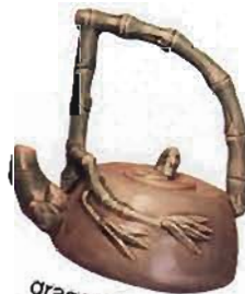
dragon tea pot Tina's Boutique

We all remember the color wheel from school, with its three primary colors (red, yellow, blue) and three secondary colors (orange, green, purple). What we did not learn is that the human eye can see more than 16 million colors – and paint manufacturers have captured virtually all of them. Colors impact our mood. Red, orange and yellow are considered warm colors and make a room appear close and cozy. The cool colors of blue, green and purple move away from you and appear more distant. To take the guesswork out of choosing a paint color, start with what you like, or draw from your favorite piece of art, a rug or fabric.