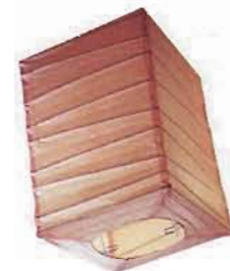
paper lantern Mud and Metal mudandmetal.com

A focal point is the direction that the eye naturally travels as it sees the room. It is the center of interest. Some spaces have an existing architectural detail as a focal point, such as a fireplace, a bay window, columns or French doors. But even if your room does not have an existing focal point, you can create one by strategically placing a work of art, a lighting fixture or a unique piece of furniture.