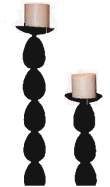
candlesticks from the owner's collection

There are two types of balance – symmetrical and asymmetrical. Symmetry is perfect balance – much like the human body has two eyes, two legs. Symmetrical balance is typically used in traditional interior design and lends to a more formal or conservative style. Asymmetry refers to imbalance, such as when two candlesticks of slightly different sizes are placed next to each other. Grouping an odd number of objects, such as three vases or five frames of varying sizes, gives a better perspective of balance than an even number of items. Asymmetry is used to add visual motion and excitement to a space. It can also denote fun and spontaneity.